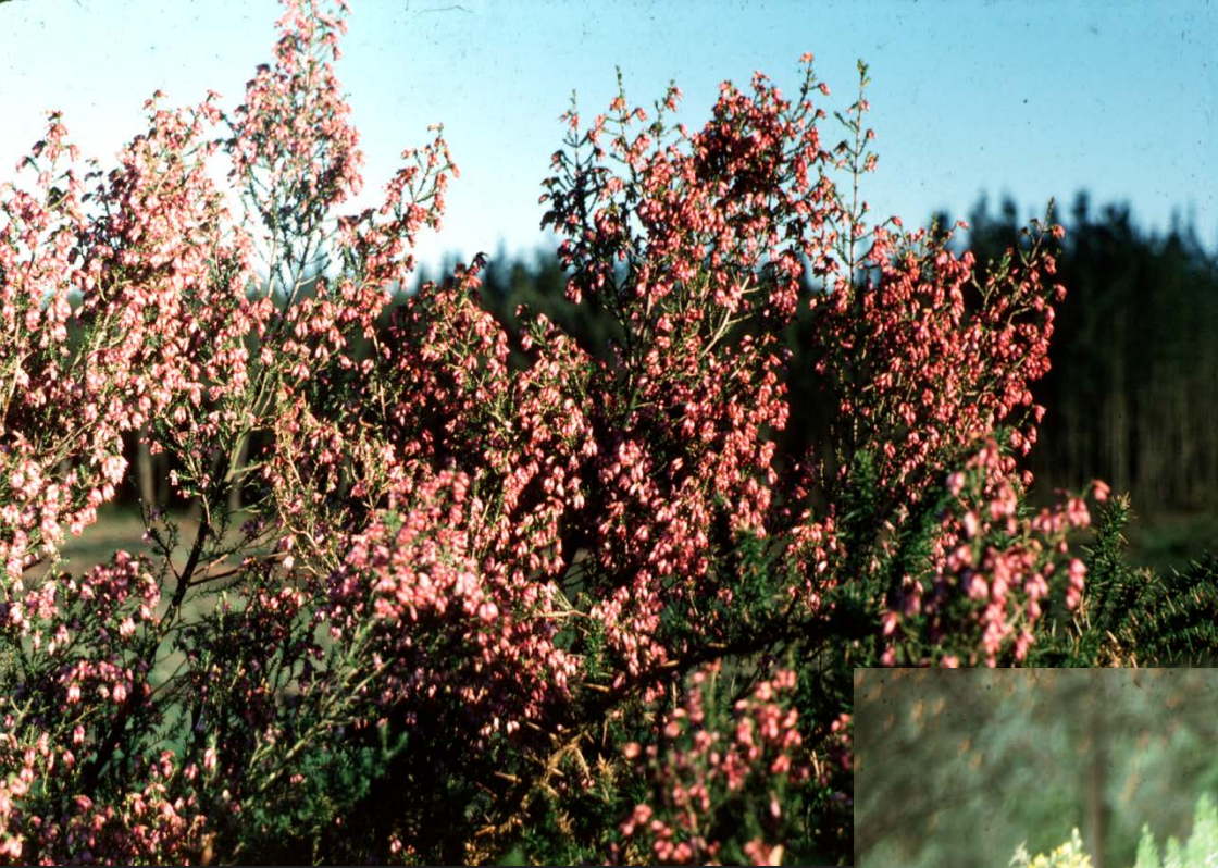
Erica australis 6% PB 16% MSD