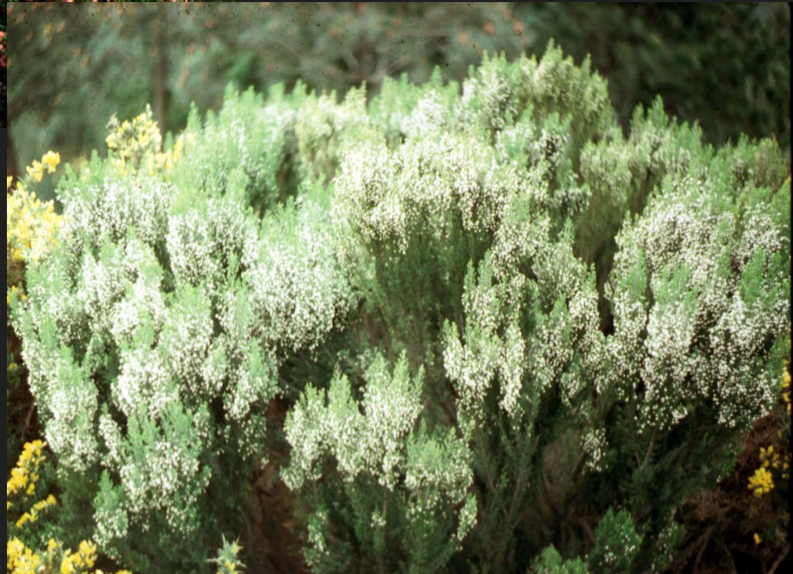
Erica arborea 8% PB 24% MSD